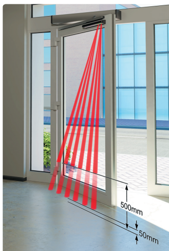
Regolazione della distanza di rilevamento